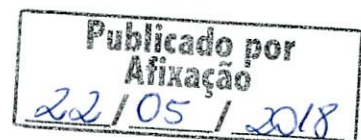
MAURO RUTHEISLER Prefeito

Gabinete do Prefeito Municipal de Brasnorte - MT, aos vinte e dois dias do mês de maio do ano de dois mil e dezoito.