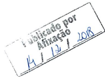
MAURO RUI HEISLER Prefeito

Gabinete do Prefeito Municipal de Brasnorte - MT, aos quatorze dias do mês de dezembro do ano de dois mil e dezoito.